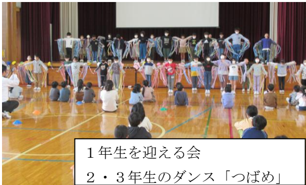
1年生を迎える会 2・3年生のダンス「つばめ」

新学期がスタートして一か月が経とうとしています。「1年生を迎える会」や「たてわり班の顔合わせ」など1年生19名の新たなメンバーを迎えて、上級生たちはウキウキしています。5月になるとお幕場遠足や運動会など学年を超えての活動が増えていきます。1年生が学校に慣れていくことはもちろん、上級生が先輩らしい行動を育てるチャンスでもあります。おうちの方からも「がんばってるね」の一言を掛けてください。