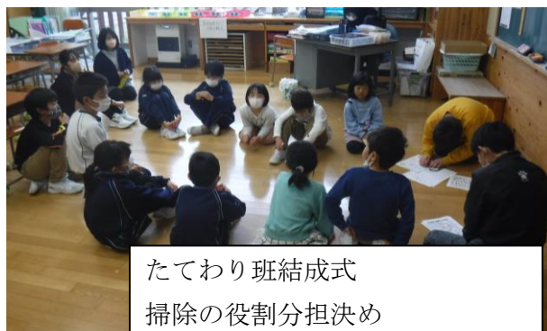
たてわり班結成式 掃除の役割分担決め