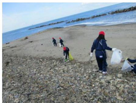
4年生の海岸清掃の様子

5年生は社会科の時間で、稲作の学習をしました。春にはJA神林さんの協力を得て、田植えを体験しました。取れたお米で、元菓子屋さんにお問い合わせして新たなお菓子づくりに挑戦します。