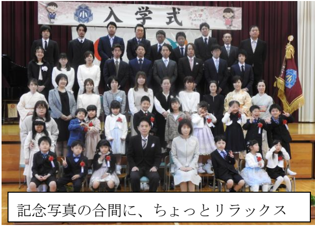
記念写真の合間に、ちょっとリラックス